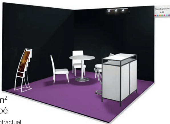
Stand 9 m 2 tout équipé