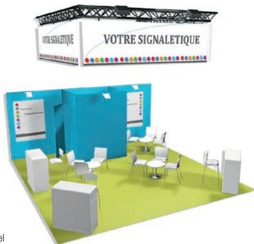
Exemple de stand 36 m 2 Confort +